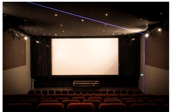
Gereneveerde zaal 1

LUX heeft in 2018 haar grootste filmzaal, LUX 1, gerenoveerd. Dit is de eerste filmzaal die vernieuwd is sinds het ontstaan van LUX in 2000. De stoelen zijn vernieuwd en de vloer en muren zijn aangepast, met zoveel mogelijk gebruik van duurzame materialen, zoals marmoleum van gedeeltelijk gerecyclede materialen (cacaoschillen), vilt en LED verlichting. Dit levert een betere filmbeleving op, door het vergroten van het zitcomfort, een betere akoestiek en een eigentijdse uitstraling. LUX 1 had plek voor 173 bezoekers, wat in 2018 teruggebracht is naar 167 (doordat de stoelen iets ruimer zijn). Een bijzonder element in de nieuwe zaal is een spannende LED-lijn die als een 'kader' door de zaal heen loopt, die symbool staat voor het kader waardoor je naar jezelf en de wereld om je heen kijkt, een visualisatie van de LUX-missie 'anders kijken'. Deze verbouwing heeft ontzettend veel positieve reacties van het publiek opgeleverd, met name over het zitcomfort.