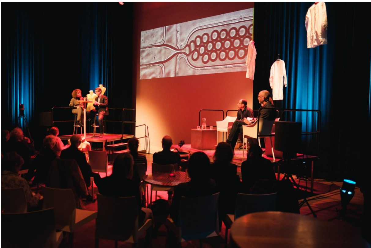
In gesprek over 'De Nieuwe Mens'; De Nieuwe Mens komt uit het lab.