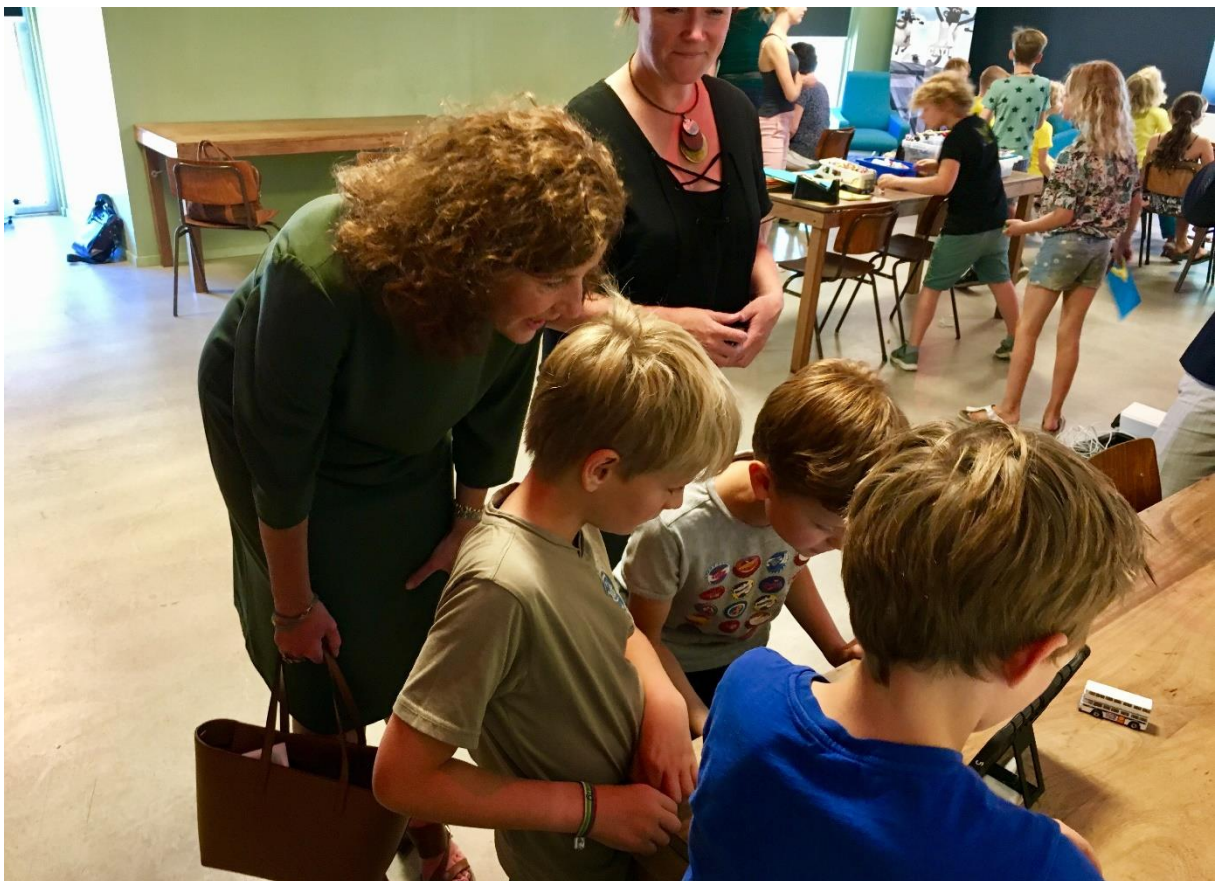
Minister van Engelshoven kijkt hoe kinderen zelf een stop motion filmpje maken in Studio LUX 02-07-2018

Het bereik onder Nijmeegse middelbare scholen is 90%, het bereik binnen deze scholen is echter zeer wisselend. Het omvat scholen die elk jaar met enkele jaarlagen deelnemen, of vanuit verschillende vakken participeren, maar ook scholen die met een enkele klas van een specifiek niveau deelnemen. Hoewel het bereik dus groot is, varieert het bereik en de insteek binnen de school sterk.